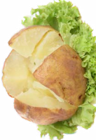
န့ၢ်တကူတၢ်