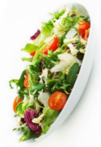
တၢ်ဒီးစံးလၢ