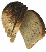
Wholegrain ကိၣ်ပီၣ်မူး