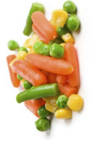
တၢ်ဒီးတၢ်လၢ်အမံ