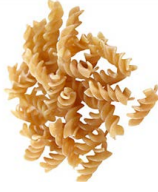
Wholegrain အံၣ်တလၢ်ဒိနီၣ်ဘိ