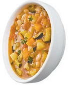
သဘၢချီၣ်တဖၣ်ဒီးပထိးချီၣ်မံၣ်