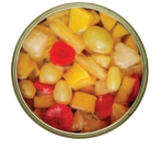
တၢ်သ့တၢ်သၢ်လၢထးဝါဒါ