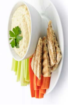
Hummus တၢ်စံထိး