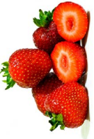
စထီၣ်ဗြၢၣ်ရိၣ်သၢ်