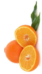
စူၣ်ဝဲသၢ်ကုလီၤသးလၢအလျာ်