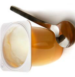
တၢ်န့ၢ်ထံဆံၣ်