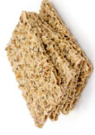
Wholegrain ကိၣ်ဘံးစၢ်းစိး