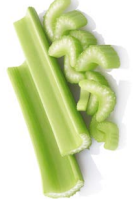
Celery sticks (စူၣ်လၢ်ရိၣ်ဘိ)