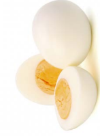
ဆီဒံၣ်ချီ