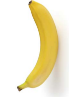
တက့ၢ်သၢ်